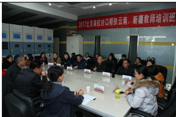
为云南、新疆教师提供培训指导