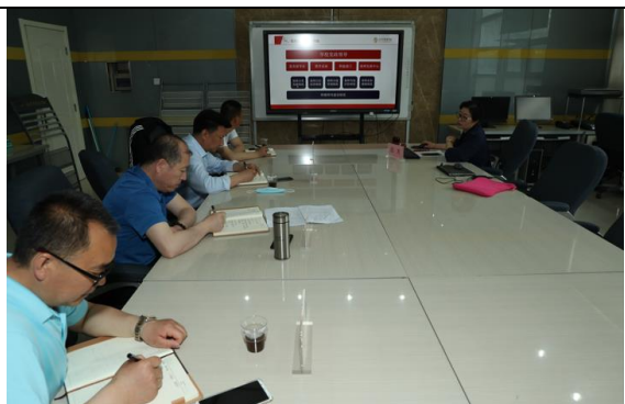
江西工程学校跟岗研修教师参与教研活动