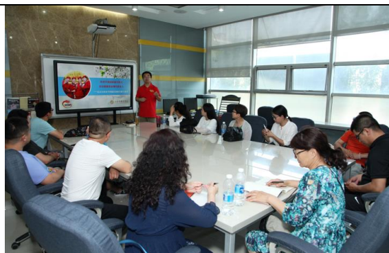
为锡林郭勒职教中心提供班主任能力提升培训