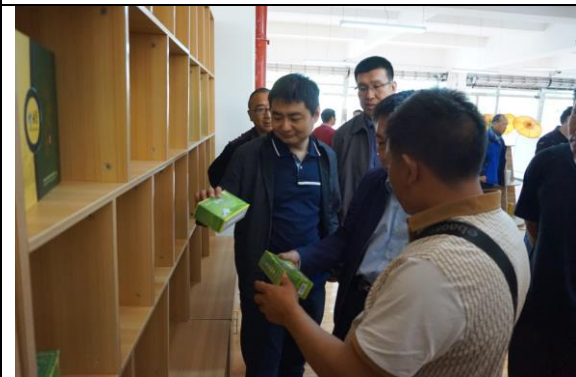
云南保山教师在校考察学习