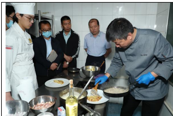
内蒙古职教干部在北京商校跟岗研修