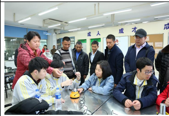
云南保山昌宁县职中管理干部参与学校教研活动