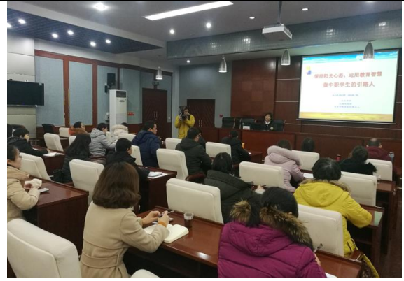
云南保山、新疆和田教师参加学校师德培训