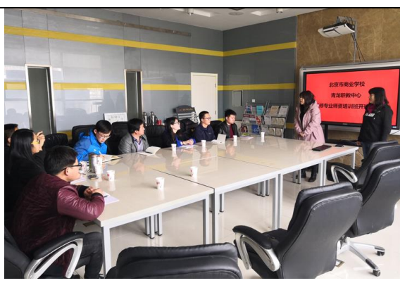
河北青龙县职教中心教师学习商校师资建设