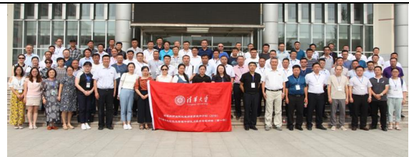
与清华大学继续教育学校合作开展教师培养讲座