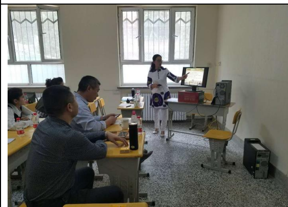
田禾老师赴新疆和田提供培训指导