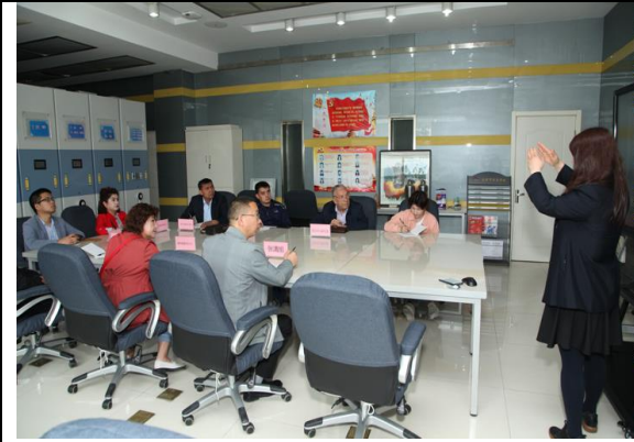
和田县职中挂职锻炼教师学习商校教师队伍建设