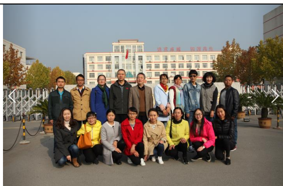
云南地区职教教师赴商校研修