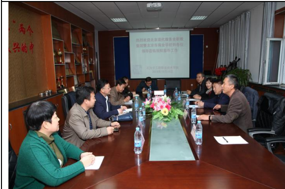
商校一行赴新疆石河子工程学校传授经验