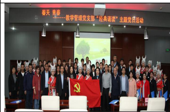
云南保山地区师生在商校学习活动