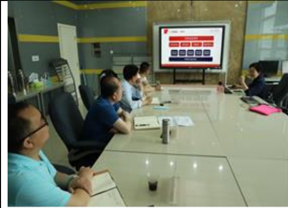
内蒙古职业院校到校学习教师队伍建设