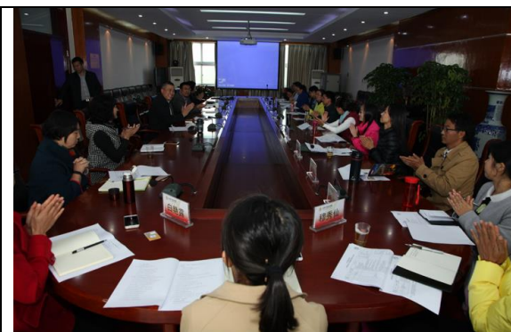
保山职教教师在商校跟岗研修开班仪式