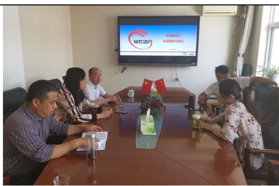
学校领导为江西跟岗研修教师讲解社会培训