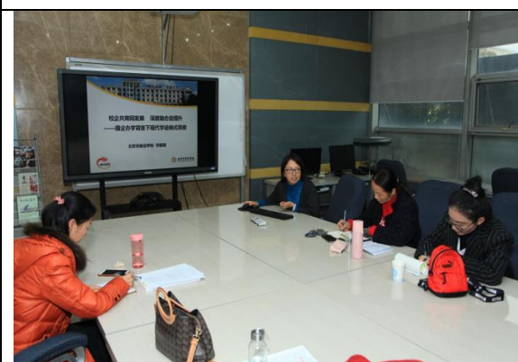
保山职教教师在商校跟岗实习