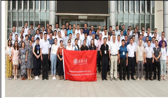
携手清华大学为贵州百所职校干部提供培训