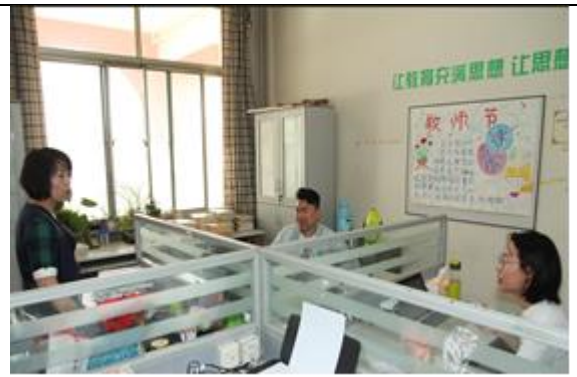
江西商务学校教师到校参加教研活动