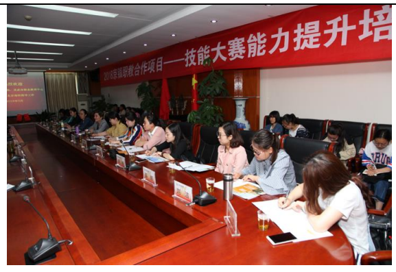
银川职业技术学院教师在校参加教学能力提升培训