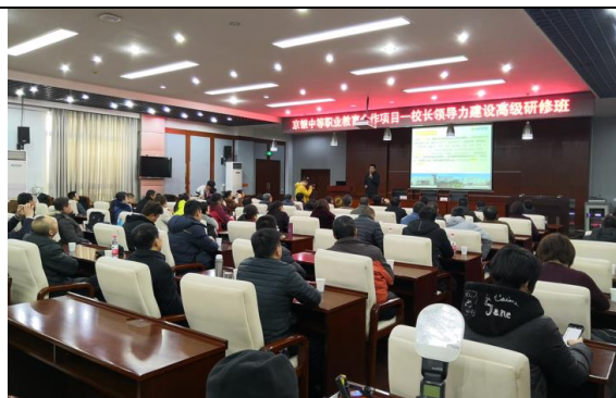
为银川职教管理干部提供队伍建设培训