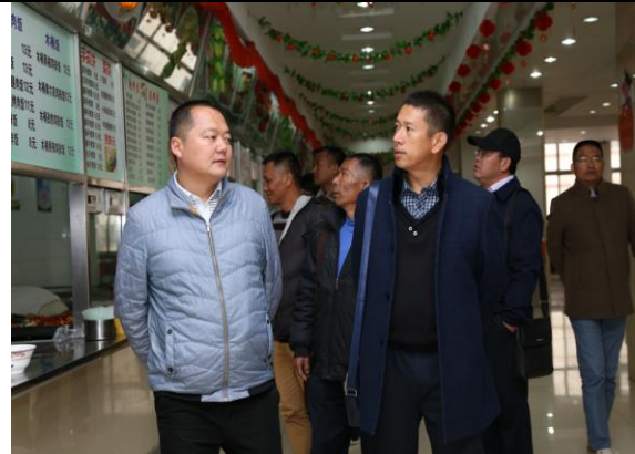
昌宁县教师到校参观学习