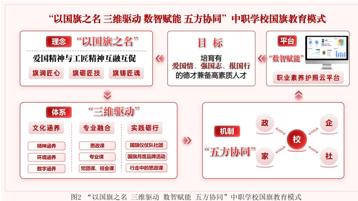
图2 “以国旗之名 三维驱动 数智赋能 五方协同” 中职学校国旗教育模式

资源感召力不足；育人实效靶向不清，职教贴合度不够；育人主体力量分散，协同格局未建立；育人技术融合不深，数智思政建设滞后”的问题，立足理念引领、体系支撑、技术赋新、机制保障，创建“以国旗之名 三维驱动 数智赋能 五方协同”中职学校国旗教育模式。开发系列国旗教育资源，做优一批品牌活动，构建“大课堂”；建立首个中职学校国旗教育实践基地，搭建“大平台”；整合政校企社资源，建好“大师资”；深化“大思政课”建设，推动思政教育“小课堂”和社会“大课堂”有效融合，培养富有“爱国情、强国志、报国行”的德才兼备高素质人才。